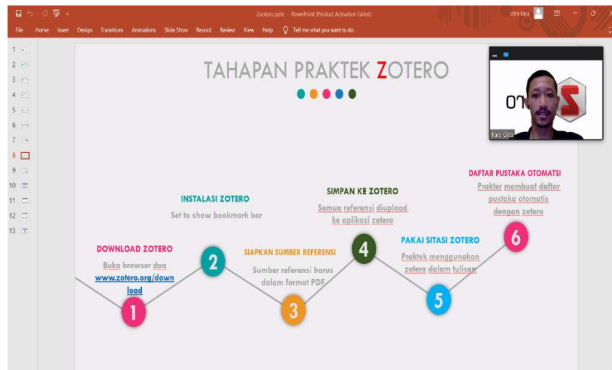
Gambar 2 Penyampaian Materi Terkait Zotero

Selanjutnya, pemateri pengabdian tidak hanya menyampaikan dan mendemostrasikan bagaimana cara penggunaan Zotero desktop, tetapi juga memperkenalkan Zotero Web Importer . Zotero Web Importer merupakan salah satu produk Zotero terbaru yang memungkinkan pengguna untuk memasukan/mengimport referensi secara langsung dari website Elsevier. Zotero Web Importer sangat memudahkan pengguna dalam menambahkan/mengimport file referensi terkait dengan judul/topik tanpa harus mendownload/mengunduh file referensi tersebut.