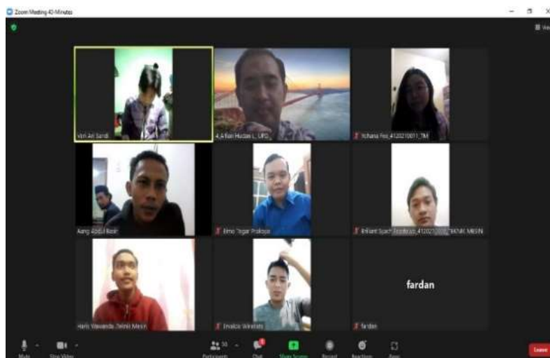
Gambar 1 Peserta Pengenalan dan Pelatihan Zotero

Materi selanjutnya adalah proses pembuatan sitasi dan daftar pustaka/referensi secara otomatis. Tahap ini, pemateri juga akan menyampaikan bahwa terdapat salah satu fitur yang dapat digunakan untuk mengubah dan menerapkan berbagai jenis model sitasi dan daftar pustaka, misalnya model APA, IEEE, Harvard, dan sebagainya. Setelah proses penyampaian materi, maka kegiatan dilanjutkan dengan pelatihan terutama cara penggunaan Zotero. Pada tahap ini pemateri melakukan demonstrasi/menunjukkan proses dimulai dari tahap Penginstalan Zotero desktop, instalasi Ms. Word plugin, penambahan file sitasi atau referensi, mengubah detail data maupun model file referensi, hingga melakukan sitasi dan daftar pustaka/referensi secara otomatis.