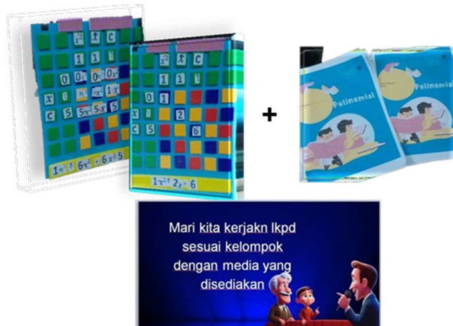
Gambar 3. Alat peraga papan polinomial, LKPD, PPT interaktif

Papan polinomial diciptakan melalui penelitian dengan penerapan metode RnD, diantaranya penelitian dan pengumpulan data melalui penyebaran angket kepada siswa terkait kebutuhan media utamanya pada materi polinomial dan didapatkan hasil bahwa 50% lebih dari mereka membutuhkan sebuah alat peraga yang dapat digunakan secara langsung, merencanakan desain dan konten yang ada pada papan polinomial yang dibuat, ketiga dilakukan pengembangan draft produk termasuk penilaian ahli materi atau ahli media guna pengembangan produk, uji coba melalui peer teaching yang dilakukan, merevisi hasil uji coba pada papan polinomial, melakukan uji coba lanjutan dan lapangan, penyempurnaan produk hasil uji lapangan, uji pelaksanaan lapangan pada siswa secara langsung, penyempurnaan produk akhir, dan yang terakhir ada pada tahap diseminasi dan implementasi.