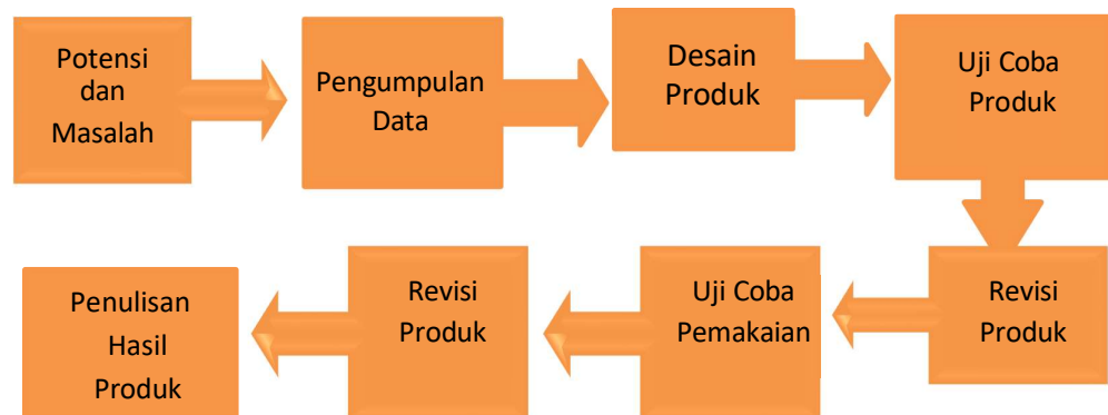
Gambar 2. Langkah-langkah penggunaan metode R&D

Prosedur penelitian pengembangan berpedoman dari desain pengembangan media oleh Borg & Gall dalam penelitian pengembangan dibutuhkan sepuluh langkah untuk menghasilkan suatu produk akhir yang siap diimplementasikan dalam lembaga pendidikan. Tetapi peneliti membatasi langkah langkah penelitian pengembangan dari sepuluh langkah menjadi delapan langkah karena mengingat waktu dan biaya yang tersedia terbatas.