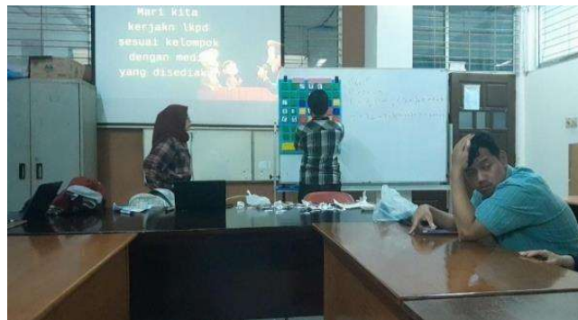
Gambar 4. Kondisi Peer Teaching di Laboratorium Media Departemen Matematika, Universitas Negeri Malang

Hasil peer teaching yang dilakukan diperoleh beberapa catatan, diantaranya papan polinomial mampu menambah pemahaman siswa terkait operasi polinomial. Hal tersebut dibuktikan di mana ketika peer teaching berlangsung siswa aktif dalam mengerjakan, bertanya, serta mampu mengerjakan soal operasi polinomial melalui peraga papan yang disediakan. Namun, setelah peer teaching dilakukan terdapat beberapa saran yang menjadi catatan untuk pengembangan alat peraga berasal dari dosen ahli media diantaranya terkait konsep penyampaian aturan pengerjaan operasi khususnya antara perkalian dan pembagian yang perlu diperjelas kembali, serta dari seluruh penunjang peer teaching mulai dari alat peraga, PPT, LKPD yang cukup menarik serta memberikan kemudahan dalam pengerjaan latihan soal dan peningkatan pemahaman konsep matematis siswa.